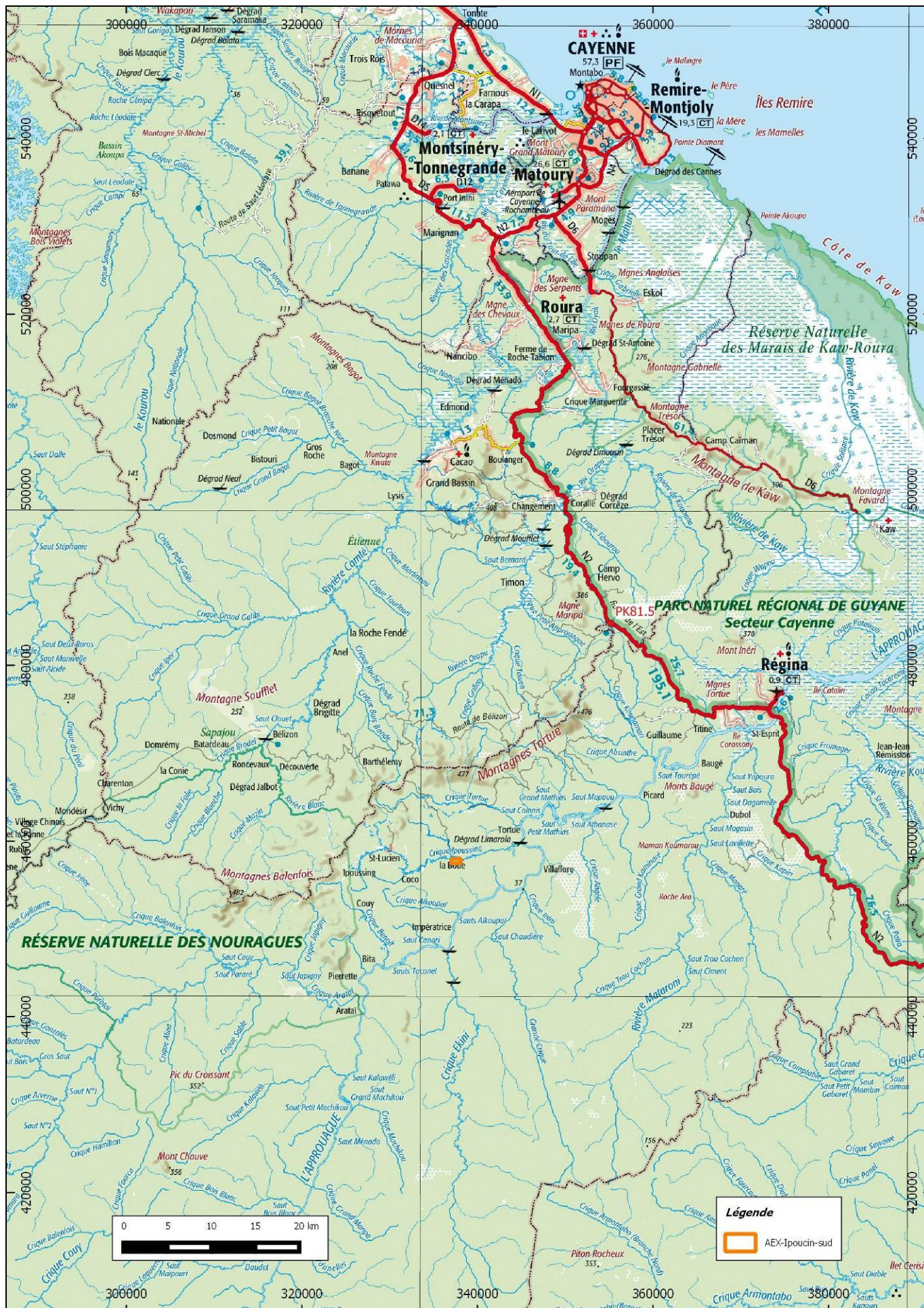
Carte de situation de l'AEX « Ipoucin sud » de la SARL JOTA d'après la carte IGN au 1/500 000° en RGFG95 UTM22